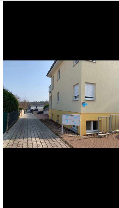
Hausansicht mit Seeweg

Die Immobilie befindet sich in belebter Wohnlage in Berlin Müggelheim (Köpenick). In unmittelbarer Umgebung des Objekts gibt es die Buslinien 169, 369 und N69. Zu Fuß erreichen Sie einige Ärzte, Restaurants, Supermärkte, zwei Bäckereien und zwei Cafés. Außerdem gibt es zwei Fitnessstudios, eine Grün- und Parkanlage, ein Museum, eine Postannahmestelle und einen Blumenladen.